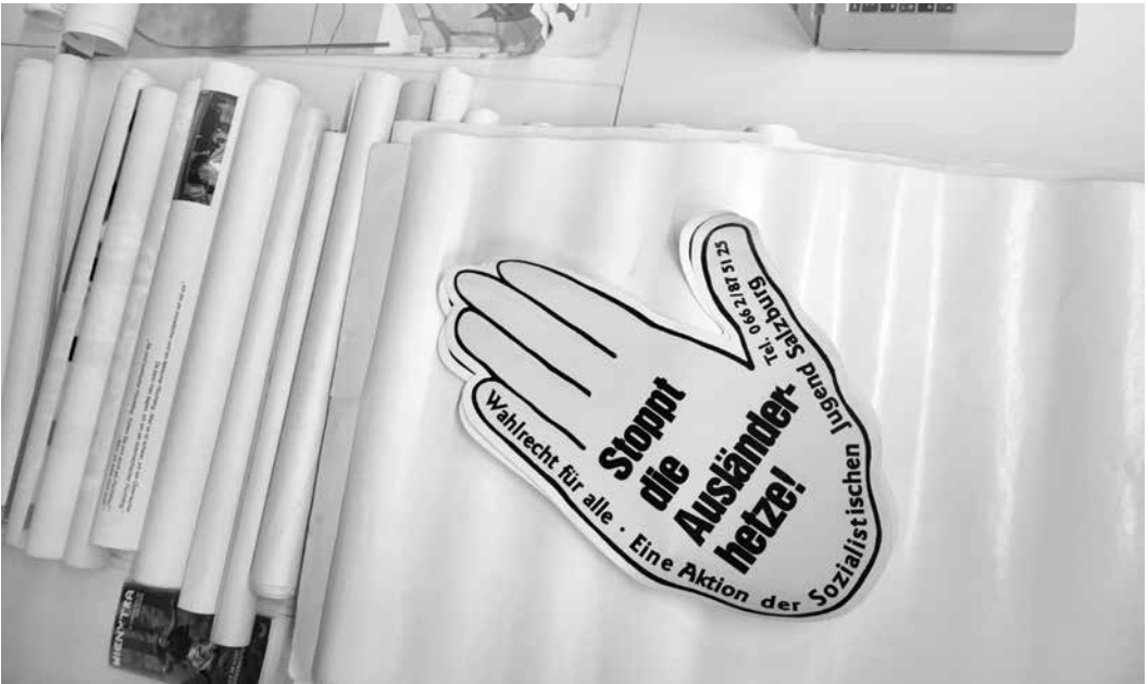
Plakat „Stopp die Ausländerhetze“, ca. 1989-1994