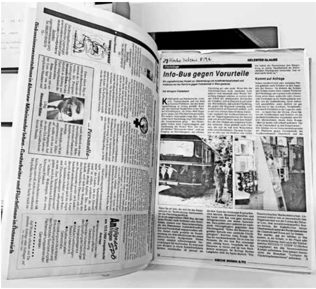
links und unten: 1992 startete das Projekt „Infobus – miteinander leben“ und tourte – ausgestattet mit Büchern, Video- und Audiokassetten, einer Ausstellung und Spielen zu den Themen Fremdenfeindlichkeit, Rassismus, Vorurteile und Rechtsextremismus durch ganz Österreich.

andere Organisationen damit um? Archiv-technisch gesehen bestehen kaum Erfahrungswerte im Umgang mit so jungen Vereinsunterlagen, die nicht rein aus einer Verwaltungsperspektive bewahrt werden sollen. Datenschutzfragen wie der Umgang mit sensiblen, persönlichen Daten sind jedenfalls von höchster Bedeutung.